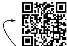
Mini dessin animé la naissance de Jésus

L'empereur Auguste décide de compter l'ensemble de la population, c'est pourquoi Joseph et Marie, enceinte, partent pour Bethléem. N'ayant pas de maison à Bethléem, Marie et Joseph se réfugient dans une étable pour donner naissance à Jésus qui sera habillé et couché dans une mangeoire.